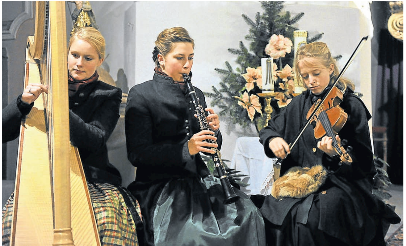
Am Sonntag wird der erste Advent gefeiert. In der Ayingen Pfarrkirche wird ab 17 Uhr wieder zum beliebten Adventssingen geladen. In der Ottobrunner Pfarrkirche St. Magdalena ebenfalls, ab 16 Uhr (mehr im Innenteil).